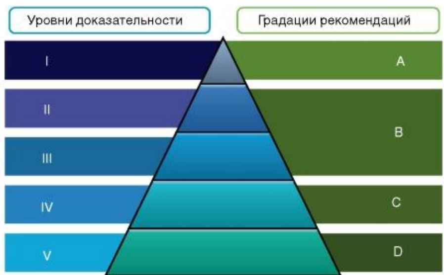
Рисунок 2. Соотношение уровней доказательности и градаций рекомендаций (Oxford Centre for Evidence-Based Medicine).

А на рисунке 2 - соотношение уровней доказательности и градаций рекомендаций.