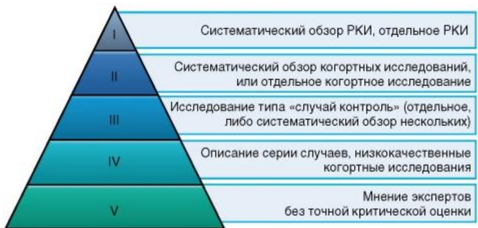
Рисунок 1. Уровни доказательности

А на рисунке 2 - соотношение уровней доказательности и градаций рекомендаций.